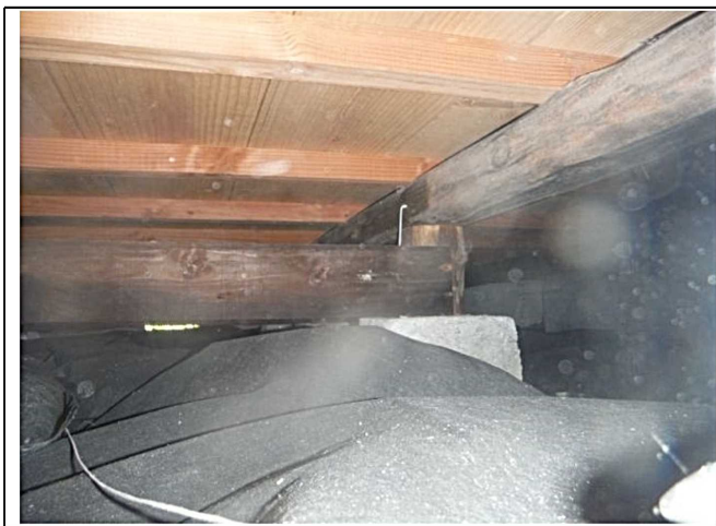
調湿材確認 根がらみ材確認