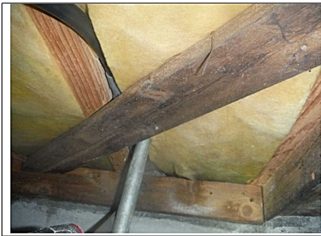
火打土台確認 断熱材確認