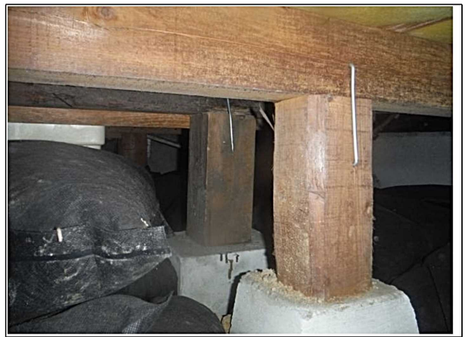
カスガイ金物確認