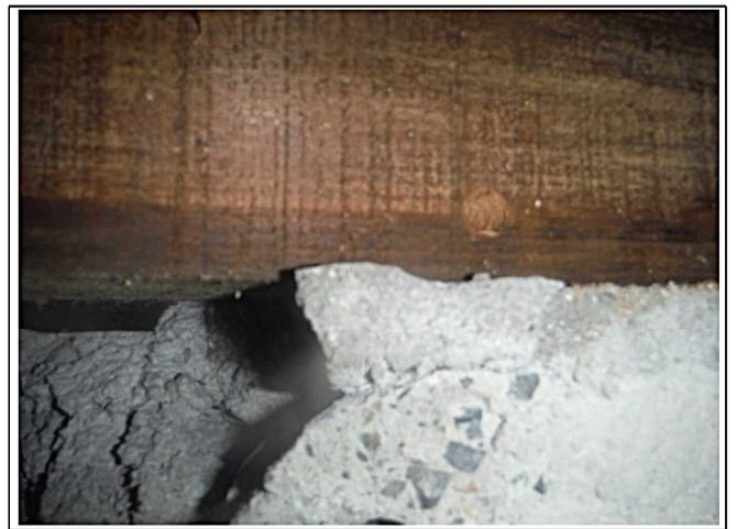
白蟻穿孔消毒跡確認