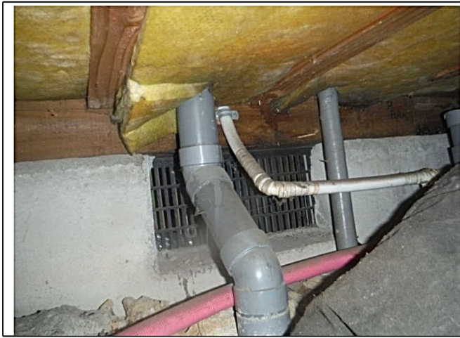
床下 台所配管 漏水等無し